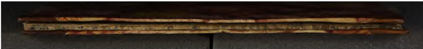
Hielmst. 193 4° (LN 1475 4° copy 2)